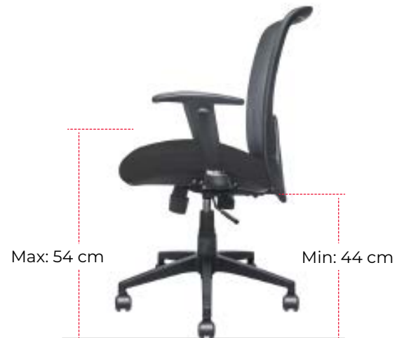
Altura máxima y mínima del asiento

Sistema up & down , el cual permite subir o bajar la altura de la silla a traves de un pistón neumático, que le facilitará posicionarse en la altura deseada o de acuerdo a la estatura de cada usuario.